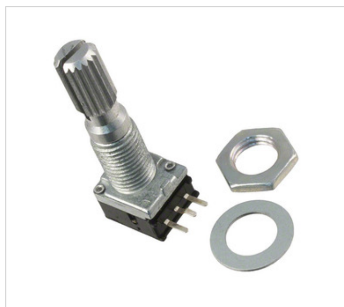
تصویر ممکن است نماینده باشد مشخصات مربوط به جزئیات محصول را ببینید